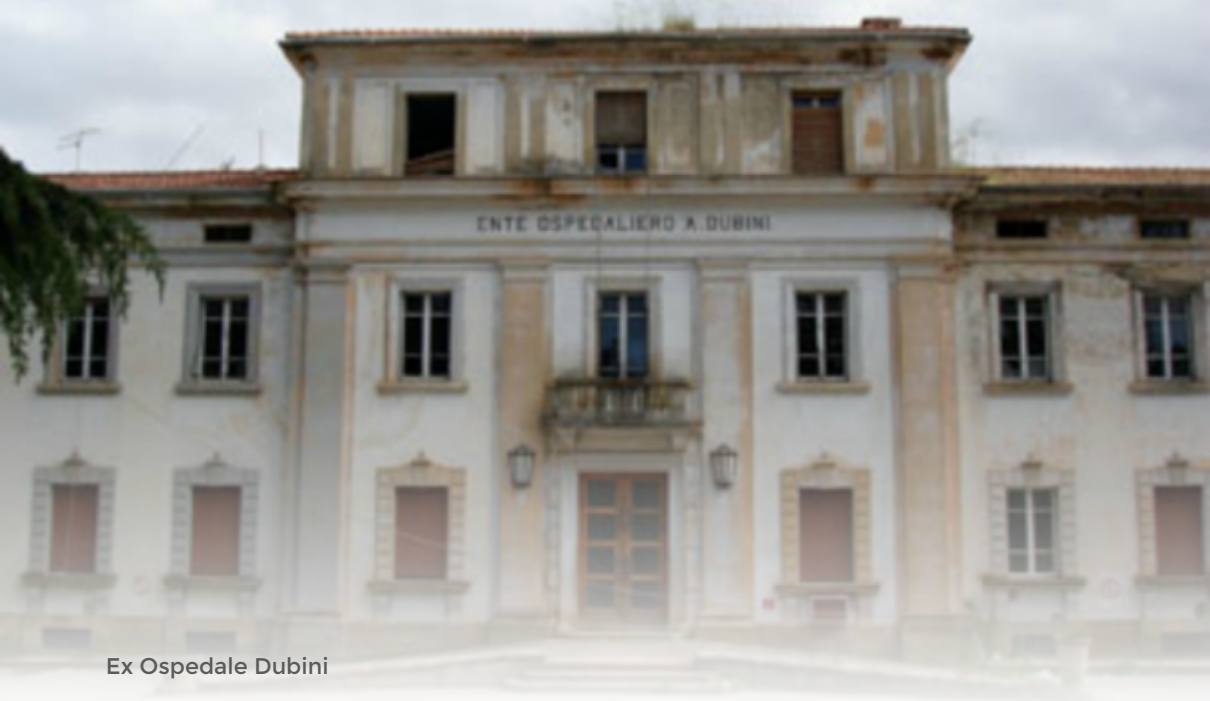
Ex Ospedale Dubini

Aggiornamento sui Percorsi di Diagnosi e Terapia